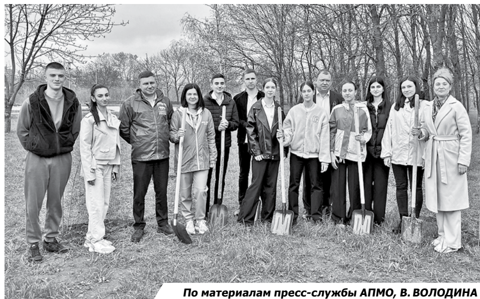
По материалам пресс-службы АПМО, В. ВОЛОДИНА